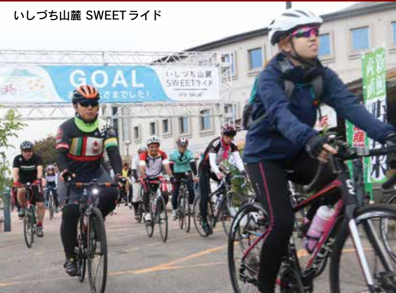
いしづち山麓 SWEETライド