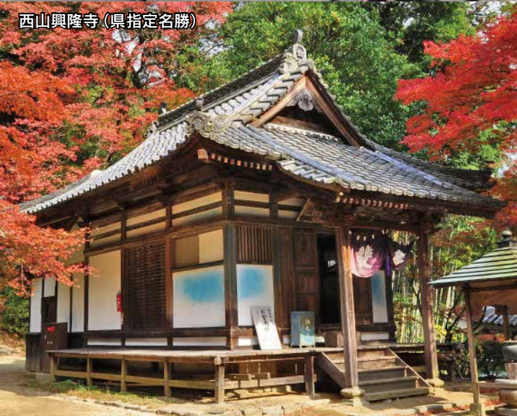
西山興隆寺 (県指定名勝)