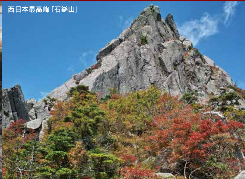
西日本最高峰「石鎚山」